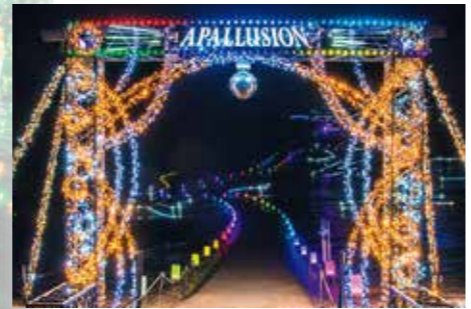
※画像は2018シーズンイメージ(ご参考)

夜景評論家丸々とお氏プロデュースの壮大なイルミネーションが広がる。新たなナイトイベントが2019年シーズンも初夏～秋期に開催される予定。 所 妙高市桶海1090 電 0570-004-111